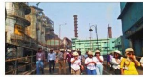
स्टील बनने की प्रक्रिया को देख कर लौटते छात्र.