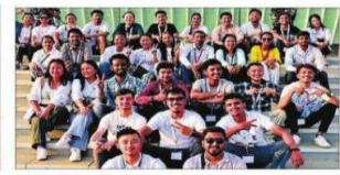
स्टेडियम के गेट पर बैठे छात्र.

आरएसपी के अंदर न्यू स्टेड मिल के बाहर छात्र. बिरसा मुंडा स्टेडियम में बिरसा स्मरण. आरएसपी के बाहर छात्रों का समूह. स्टेडियम के गेट पर बैठे छात्र. स्टील बनने की प्रक्रिया को देख कर लौटते छात्र. भ्रमण दौरा में बिरसा मुंडा स्टेडियम में बिरसा स्मरण. स्टील बनने की प्रक्रिया को देख कर लौटते छात्र. भ्रमण दौरा में बिरसा मुंडा स्टेडियम में बिरसा स्मरण. स्टील बनने की प्रक्रिया को देख कर लौटते छात्र. भ्रमण दौरा में बिरसा मुंडा स्टेडियम में बिरसा स्मरण.