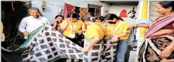
नवभारत ब्यूरो। राउरकेला।

युवा संगम कार्यक्रम के तहत सिक्किम से आई 37 सदस्यीय टीम ने संबलपुर जिले का दौरा कर यहां की कला, संस्कृति व परम्परा से रुबरु हुई। एक भारत श्रेष्ठ भारत के तहत युवा संगम कार्यक्रम के अंतर्गत सिक्किम से आए युवाओं की टोली की मेजबानी पुनर्आईटी राउरकेला ने की। उन्हें अपने कैम्पस में ठहराया। उन्होंने ओड़िशा दौरे में संबलपुर जिले का भ्रमण किया। सिक्किम के अलग-अलग जिले से से आए 25 युवा और पुनर्आईटी सिक्किम के सात छात्र व 4 कर्मचारी, एक प्रोफेसर ने संबलपुर के हीराकुंड डैम और