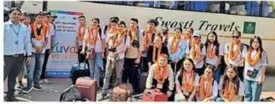
राउरकेला पहुंचा एनआईटी सिक्किम का दल।

एक भारत श्रेष्ठ भारत (ईबीएसबी)-युवा संगम कार्यक्रम के तहत युवा संगम कार्यक्रम शिक्षा मंत्रालय, भारत सरकार की एक पहल है, जो लोगों के बीच संपर्क को मजबूत करने के लिए बनाई गई है। राज्यों के विभिन्न पहलुओं, विकास स्थलों, हाल की उपलब्धियों और युवा के बीच