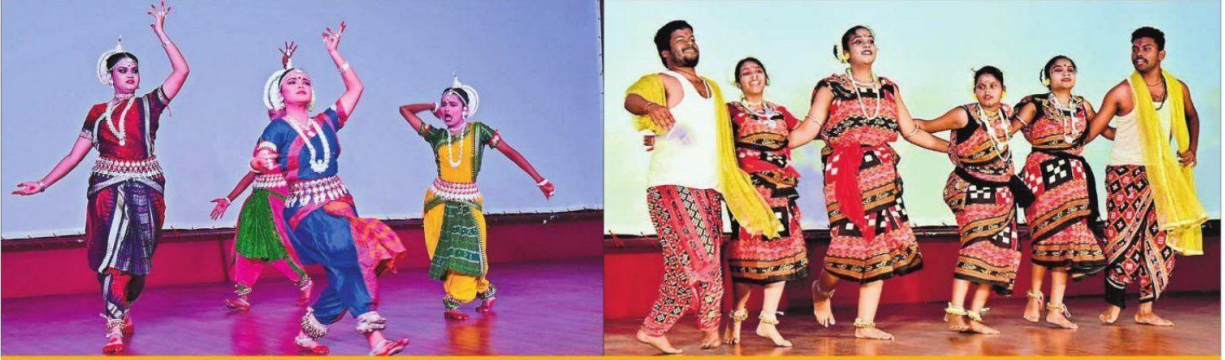
एनआइटी परिसर में रंगारंग सांस्कृतिक कार्यक्रम का किया गया आयोजन