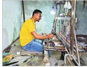
हथकरघा पर हाथ आजमाता छात्र.

पांच दिवसीय दौरे पर आये सिक्किम के 25 छात्रों का समूह मंगलवार को संबलपुर के प्रसिद्ध हीराकुद डैम देखने के लिए पहुंचा. डैम को घूमकर देखने के साथ इसकी विस्तारिता व निर्माण से जुड़ी जानकारी भी छात्रों ने ली. खासकर सात टाक पुंरने इस डैम की इंजीनियरिंग को देखकर सभी छात्र आश्चर्यचकित हुए. डैम के सुर्रिटेडिड अभियंता (मेकेनिकल) प्रिब्रजन वंश ने सभी बुनावटों को डैम की निर्माण प्रणाली और कंस्ट्रक्शन से अवगत कराया. डैम की विस्तार और प्रिब्रसन के बारे में समझाने हुए उन्होंने छात्रों को कंस्ट्रक्शन और ऑपरेशन के तरीके भी समझाये. पूरे सफर डैम किस तरह से ऑपरेट होता है एवं बारिश के दिनों में किस तरह से यहां रखरखाव