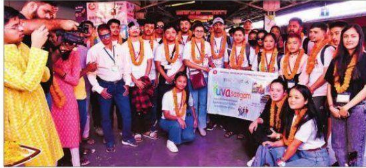
सिक्किम के छात्रों का राउरकेला रेलवे स्टेशन पर स्वागत करते एनआइटी के अधिकारी.

पांच दिवसीय दौरे में यहां की कला-संस्कृति से अवगत होने छात्र: सिक्किम के अलग-अलग जिलों से आये सदस्यों का स्टेशन पर लोक कलाकारों ने स्वागत किया। एनआइटी राउरकेला को ओडिशा राज्य से नोडल संस्थान के रूप में चुना गया है और युवा संगम युवा विनिमय कार्यक्रम की