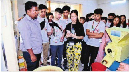
एनआइटी कैंपस को घूमकर देखते सिक्किम के छात्र तथा रविवार शाम को आयोजित सांस्कृतिक कार्यक्रम में प्रस्तुति देते छात्र-छात्राएं व उपस्थित अतिथिगण.

युव एक्सचेंज प्रोग्राम के तहत राउरकेला पहुंचे सिक्किम के 25 सदस्यीय छात्रों के समूह ने रविवार को नेशनल इंस्टीट्यूट ऑफ टेक्नोलॉजी (एनआइटी) कैंपस एवं अलग-अलग विभागों को भ्रमण देखा. इस दौरान एनआइटी राउरकेला की टीम सभ में थी और छात्रों को सभी विभागों की गतिविधियों के बारे में विस्तार से बताया. इसके अलावा एनआइटी कैंपस में स्थित आकर्षक स्थलों को भी समूह ने देखा, जिसमें एनआइटी तालाब शामिल है. एनआइटी के अलग-अलग विभागों ने रविवार को सिक्किम के छात्रों ने कंप्यूटर इन्फर्मेटीक्स सेंटर एवं स्मार्ट लेक्चर हॉल का दौरा किया. बाद में एनआइटीआइ भी छात्र पहुंचे और यहां होनेवाली गतिविधियों को जाननेकी ली. इससे पहले रविवार को छात्रों के