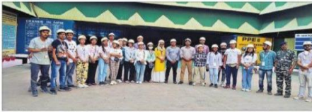
आरएसपी के अंदर न्यू स्टेड मिल के बाहर छात्र.

युवा एससबीज प्रोग्राम के तहत सिक्किम से आये 25 छात्रों के समूह ने सोमवार को राउरकेला स्टील प्लांट के विभिन्न विभागों का दौरा किया। कड़ी सर्वांगीण जवाबदायिगी के बीच छात्रों को आरएसपी के विभिन्न विभागों में ले जाकर स्टील बनने की पूरी प्रक्रिया को समझने से दिखाया गया। छात्रों के लिए यह सफरभर से नया अनुभव था, जिसका सफेद ने अनंत उदया। छात्रों के सफाई का