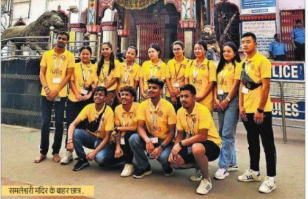
समलेखी मंदिर के बाहर छात्र.